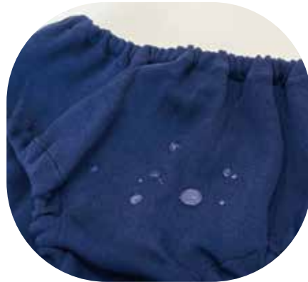
撥水生地で濡れても平気♪