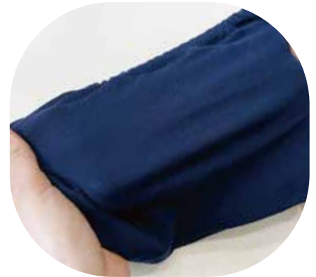
しっかり伸びてフィット!